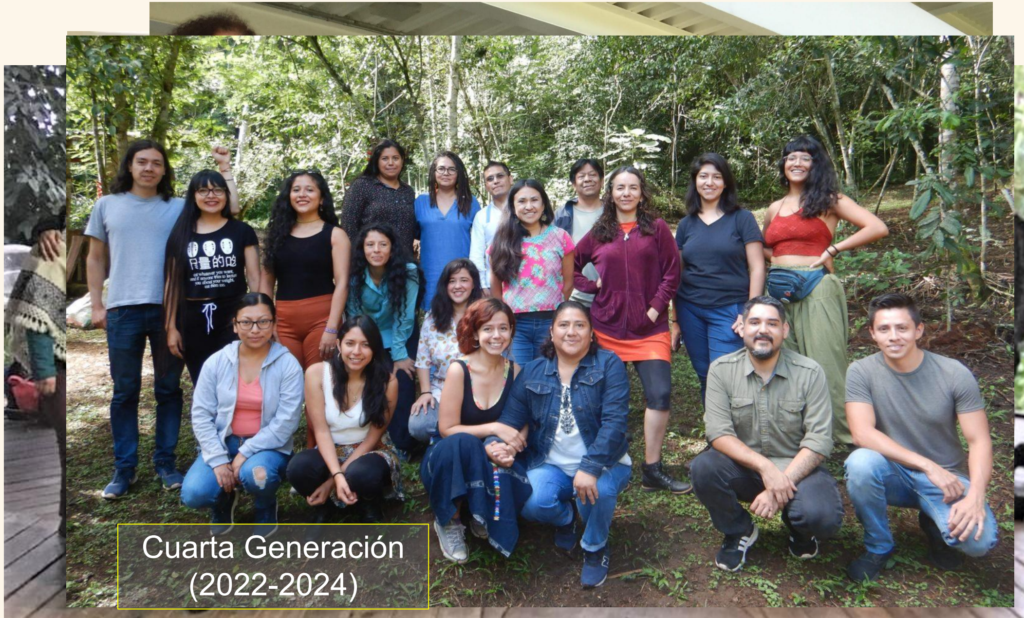
Cuarta Generación (2022-2024)