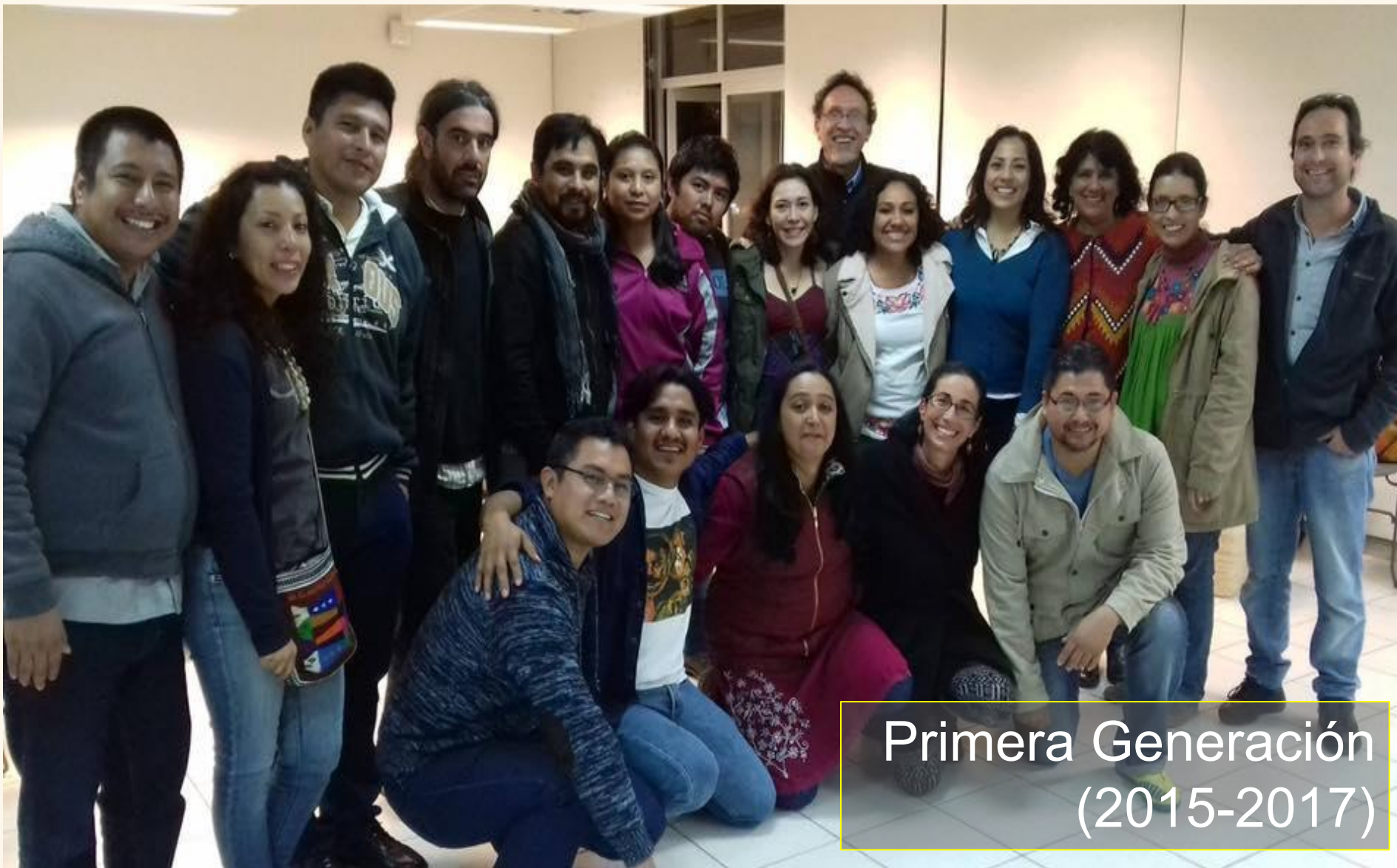
Primera Generación (2015-2017)