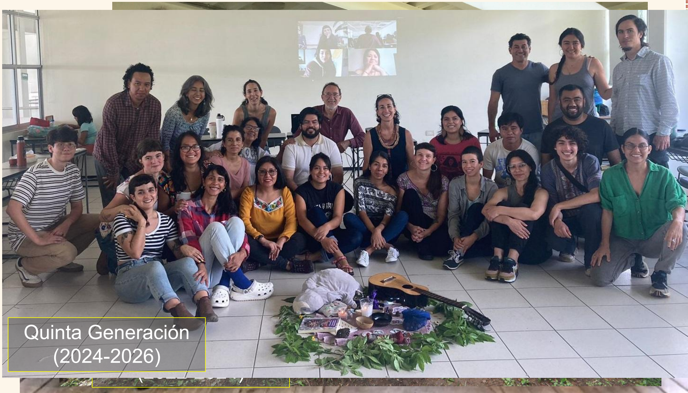
Quinta Generación (2024-2026)