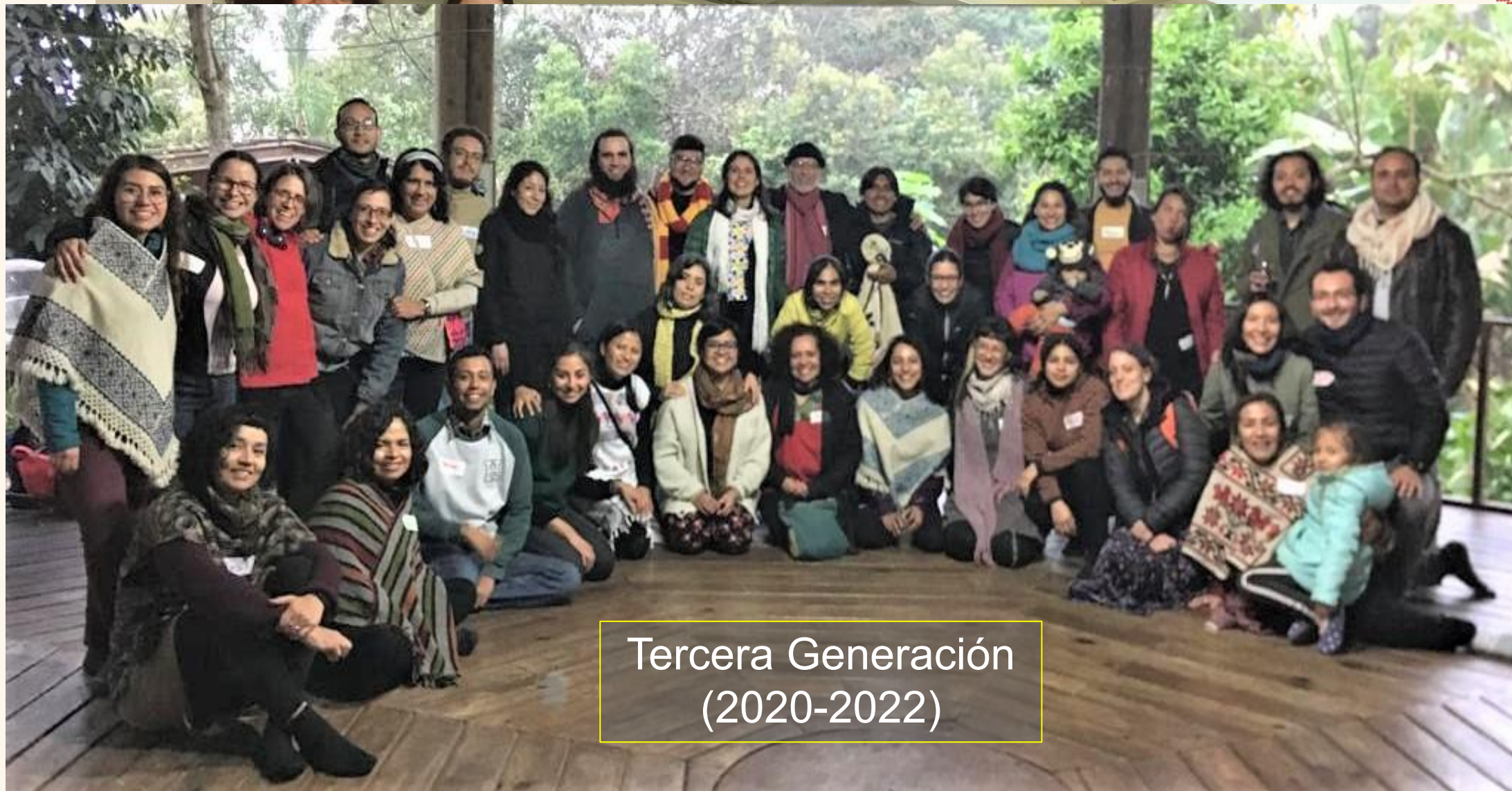
Tercera Generación (2020-2022)