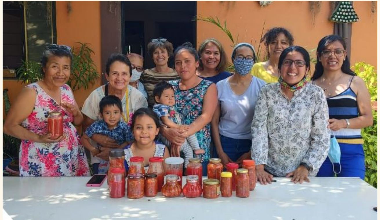
Colectivo de Aprendizaje en Alimentos Sanos (CAAS) 135 familias